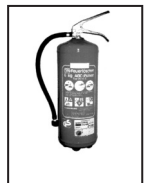
6 kg powder extinguisher Type I 10 (extinguishing agent) units according to DIN EN 3

Nettopreise zzgl. gesetzlicher MwSt. | All prices are net. German VAT to be added.