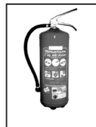
6 kg Pulverlöscher Typ I 10 LE (Löschmitteleinheiten) gem. DIN EN 3